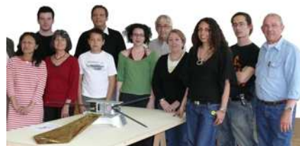
Le projet de cubesat « Libellule » imaginé le 18 mai 2008 à Amboise