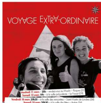
Les filles de La Grosse Situation

Trois filles « out of this world » qui sont parties avec leur sac à dos suivre le fil des aventures extraordinaires de Jules Verne. Elles en ont fait un grand et très étonnant spectacle où elles nous entraînent dans leur fougueuse passion.