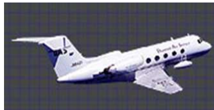
Un jet d'affaires qualifié pour les vols Zéro-G avec huit expérimentateurs.

Au Japon, le choix de DAS, « Diamond Air Services », la filiale Zéro-G de la société Mitsubishi, s'est porté sur un petit jet d'affaires, le « Gulfstream-II ». Cet avion classique conviendrait très bien pour un développement régional avec un rythme hebdomadaire de vols soutenus par la clientèle aisée et les touristes haut de gamme, mais aussi par les institutions et les entreprises pour les besoins de la recherche.